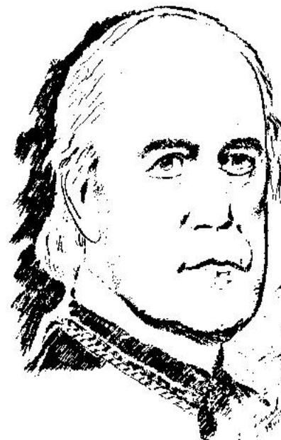
Wilhelm Emanuel von Ketteler