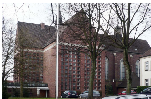
St. Antonius, Freisenbruch

Eventl. Änderungen des Programms oder zusätzliche Veranstaltungen werden rechtzeitig in den Versammlungen, im Schaukasten oder im Pfarrheimfenster bekannt gegeben.